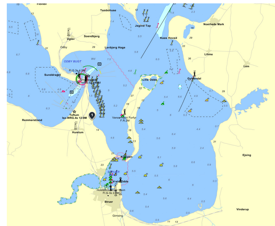
Figur 1. Humlum Camping (1) ved Venø bugt